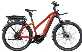
Charger Mixte GT rohloff / sunrise