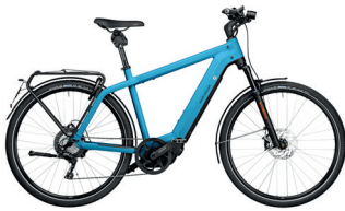
Charger touring HS / caribbean matt

Charger mixte: Rahmengröße: 46, 49, 53 || Rahmenfarbe: sunrise, storm blue matt, ceramic white