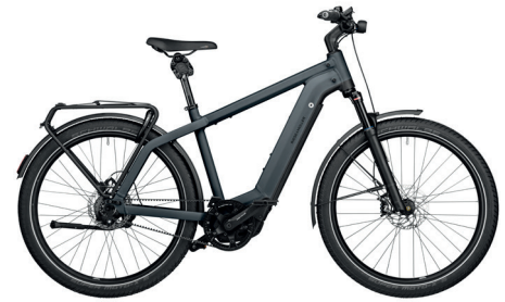
Charger GT rohloff / storm blue matt

Optionales Zubehör: DualBattery 1125, Frontgepäckträger, GX-Option, Kiox Cockpit